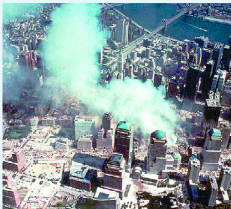
Los atentados del 11 de septiembre de 2001 cambiaron la mentalidad estadounidense.

Y por el camino, conocemos a Ahmad, un adolescente sensible y extremadamente crítico con la sociedad occidental, con el consumismo, la superficialidad, tan temeroso como deseoso de sexo, reflexivo, poco sociable... Un adolescente. Y de ahí la pregunta: ¿cómo llega un chico normal a convertirse en un terrorista? Porque Ahmad no es la única voz crítica que aparece en la novela. También está el contrapunto del clérigo Rashid, Jack Levy, un judío no practicante, descreído del mundo y la religión, profesor y tutor de Ahmad. ¿Por qué no se deja Ahmad guiar por él? ¿O quizás sí? Descúbranos por ustedes mismos.