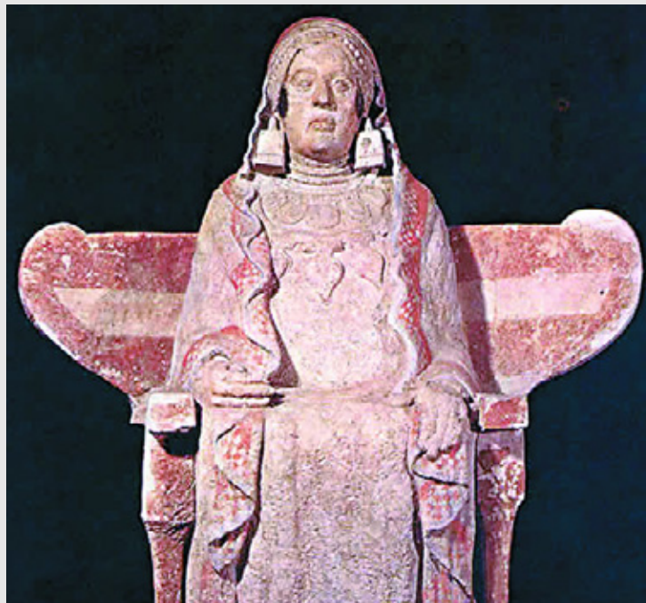
La dama de Baza, uno de los mejores ejemplos de arte ibérico.

norama bastante claro de esa España Antigua de la que tanto escribió el profesor García Bellido, analizando la huella de los fenicios en España y la de los propios pueblos indígenas. Iberia abandonó el escenario brumoso de los primeros tiempos con la llegada de las colonias griegas, y sobre todo, al servir de campo de batalla entre romanos y cartagineses, algo que decidiría el destino del Mundo Antiguo.