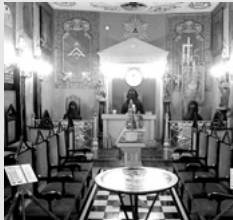
Una logia masona.

Título: Historia de las sociedades secretas españolas. Editorial: Zenith. Precio: 19 euros. Lo mejor: La objetividad expositiva. No se hacen juicios de valor. Lo peor: Algunos movimientos se despachan muy brevemente.