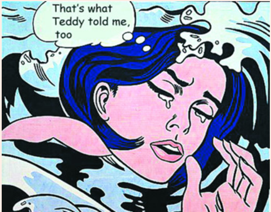
Una obra de Roy Lichtenstein.

Peró la cuestión es que la narrativa pop está demostrando su garra, su ca-