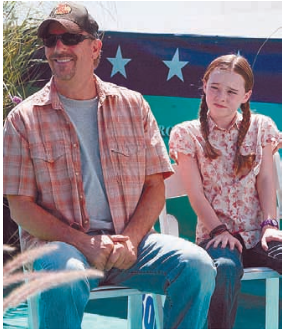
▼ INMADURO. Toda la inmadurez que le falta a Bud Johnson (Costner) le sobra a su hija (Carroll).